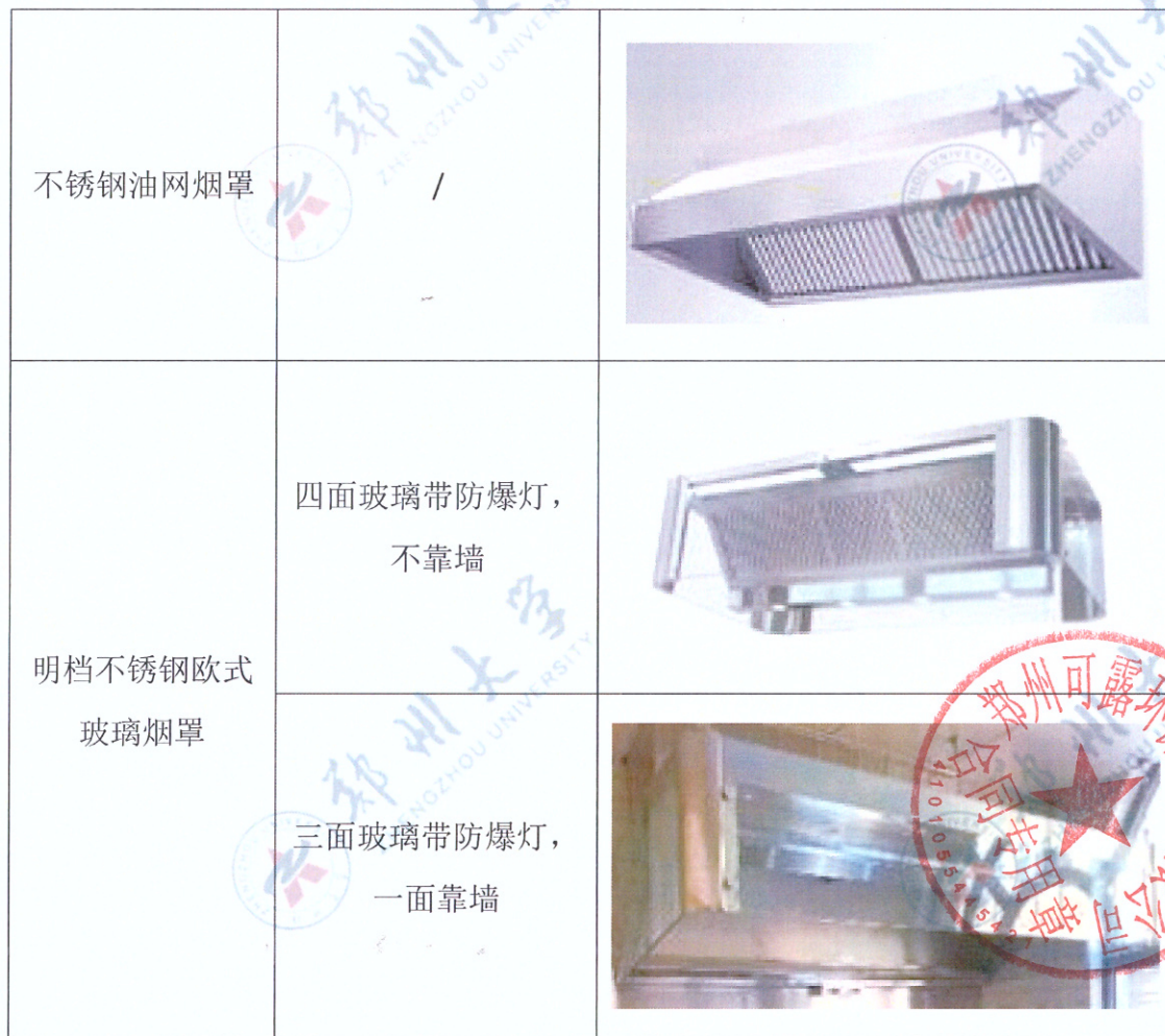
附新制不锈钢烟罩参考图片、明档不锈钢欧式玻璃烟罩图片

14.1 产品安全性能需符合国家电气安全标准 GB 4706 系列相关标准，确保绝缘性能、接地保护、防触电设计等满足安全使用要求。提供该设备工况下带电部位绝缘、接地保护、泄露电流和电气绝缘强度达标的具有 CMA 标识的检测报告。