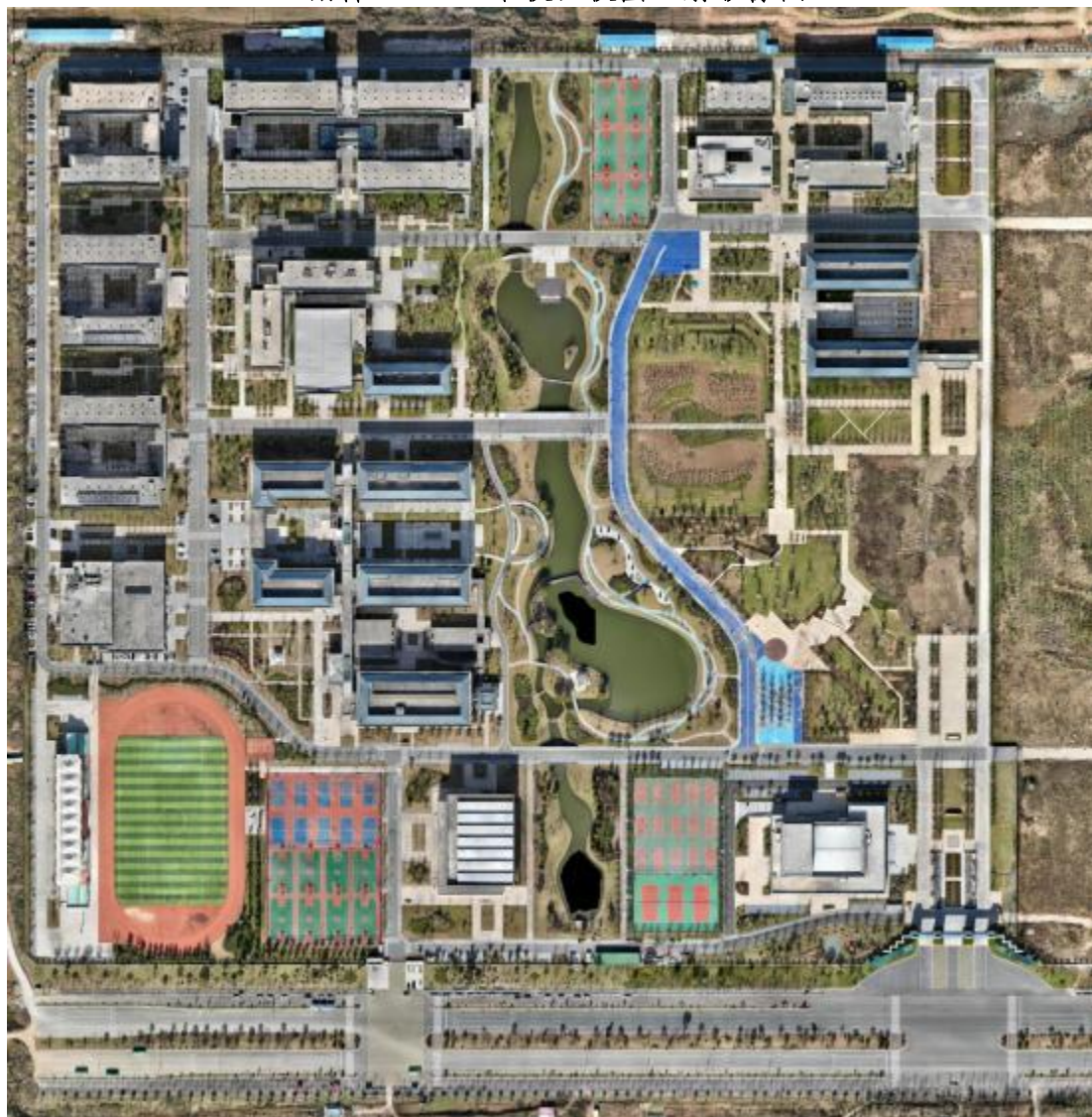
附件 2.3 江淮校区校园正射影像图