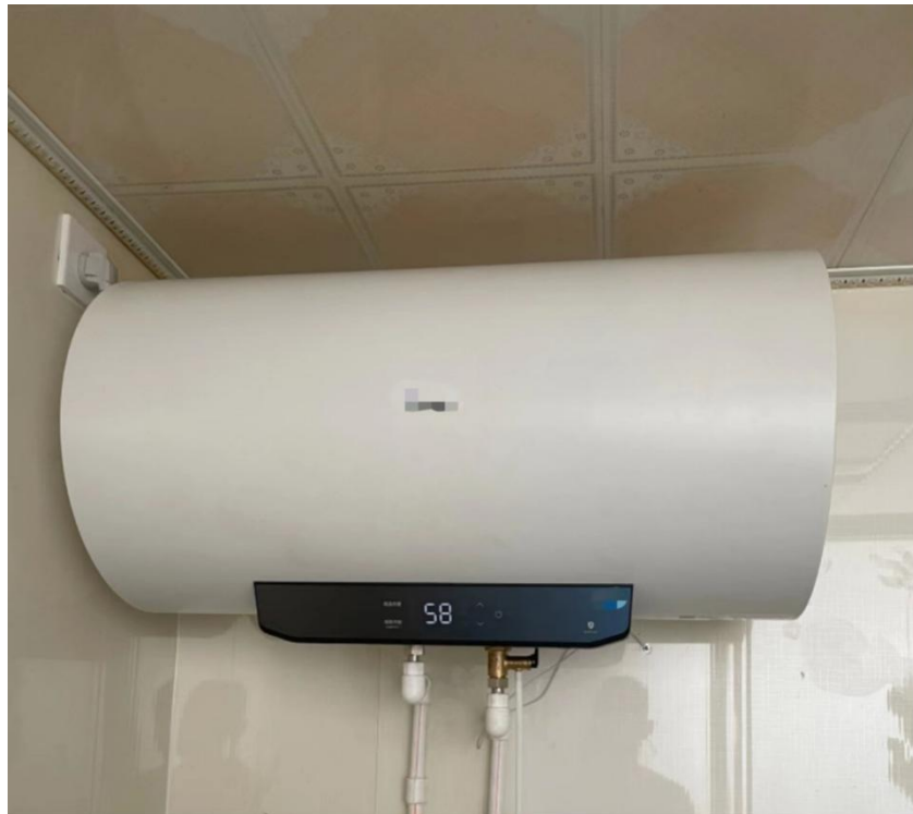
图 4：电热水器及安装参考样式