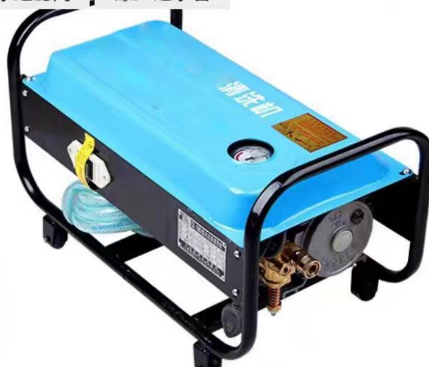
加工机械清洗设备