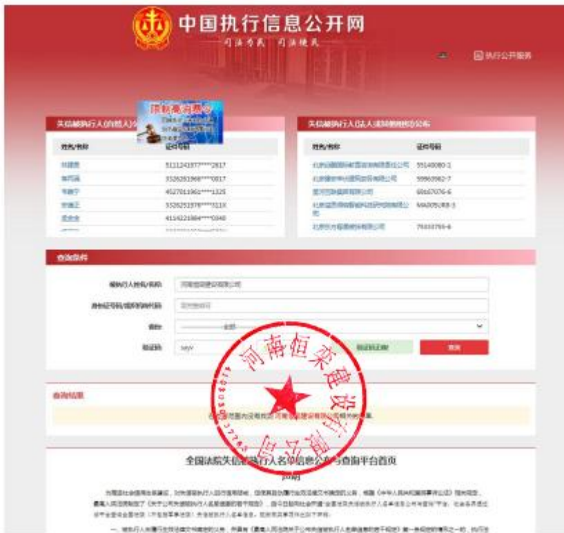
“中国执行信息公开网”网站的“失信被执行人”截图