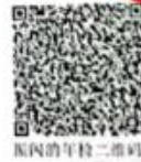
国内的年检二维码